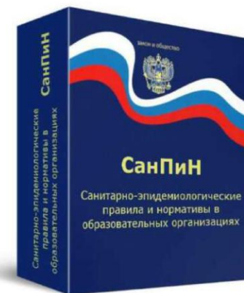
Санитарно-эпидемиологические правила и нормативы СанПиН 2.4.2.2821-10 утратили свою силу с 1 января 2021 года

Обращаем внимание на то, что при любой температуре образовательная организация обязана организовать учебный процесс для любого количества обучающихся, в частности правовых оснований отмены учебных занятий из-за сильных морозов в настоящее время не имеется.